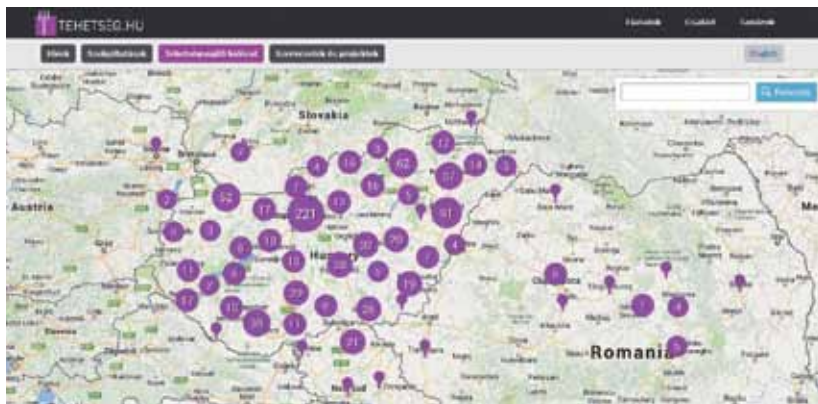
A Tehetségpontok hálózata

A portrégyűjtemény folyamatosan gyarapszik, a Tehetséghidak Program keretében készülő kisfilmek és interjúk is elérhetők innen.